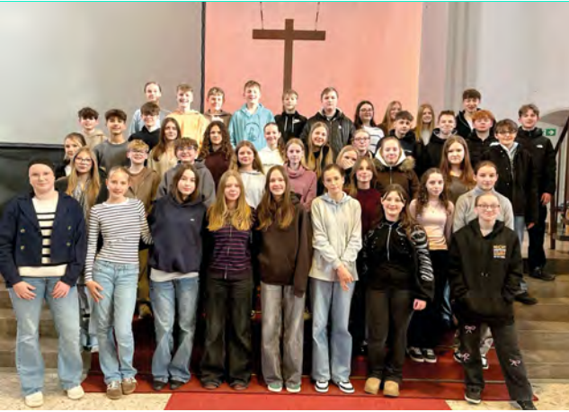
Das Foto entstand beim kreiskirchlichen Konfirmandentag am 7.2.26 in der Christuskirche; es zeigt nicht alle KonfirmandInnen