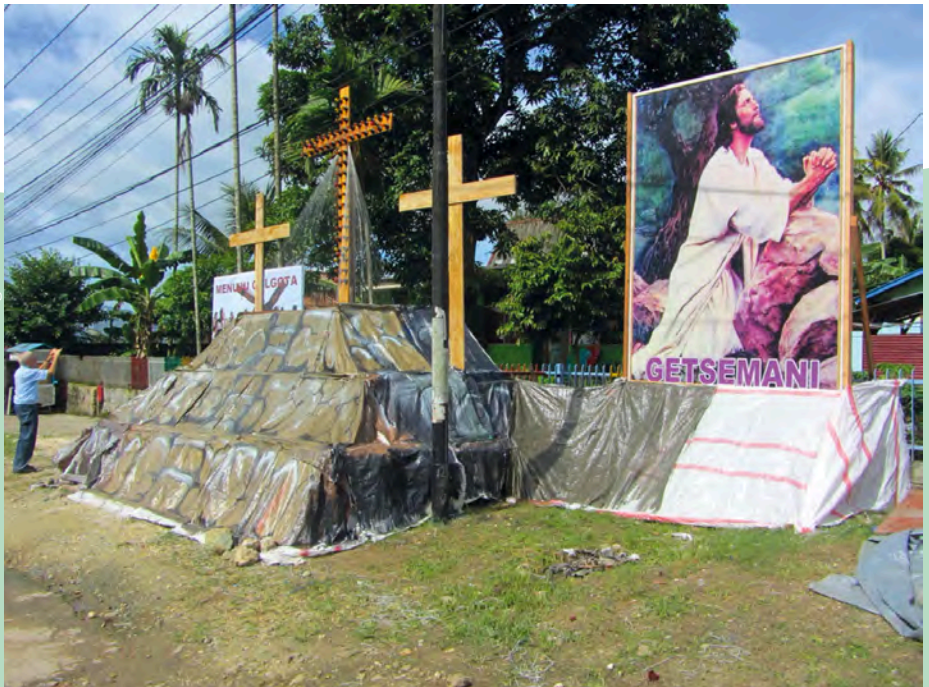
Passion in Westpapua